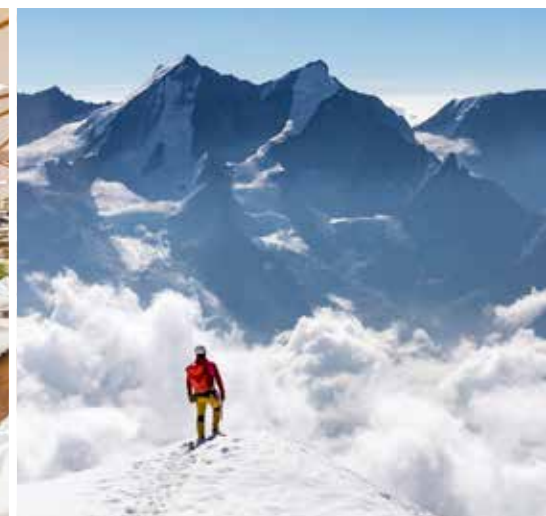
⚡ Afdaling vanaf de 4.505 meter hoge Weisshorn naar de Weisshornhütte.