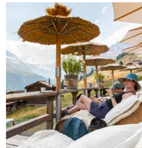
☕ Koffie met taart op een terras bij Zermatt en genieten van het uitzicht.